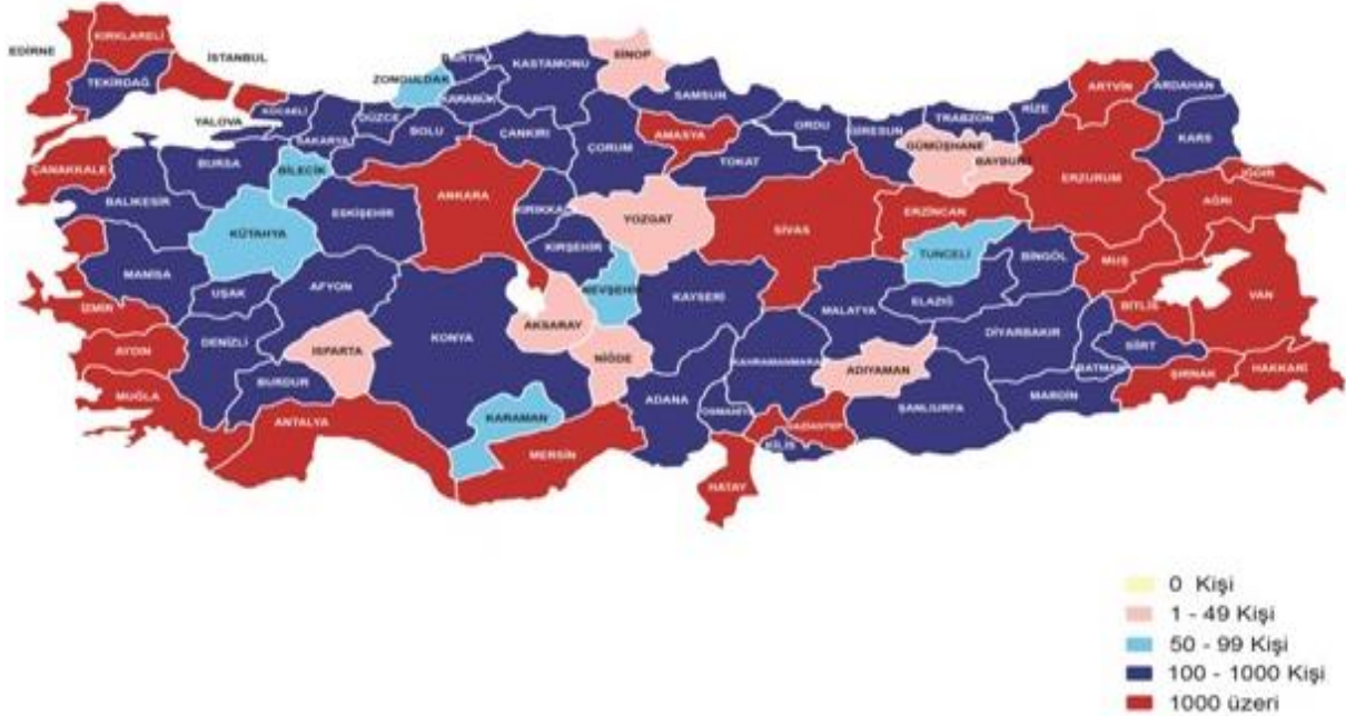
Şekil 1. 2017 Yılı İtibariyle Yakalanan Düzensiz Göçmenlerin Coğrafi Dağılımı

Türkiye; Karadeniz Bölgesi, Ege Bölgesi, Marmara Bölgesi, Akdeniz Bölgesi, İç Anadolu Bölgesi, Doğu Anadolu Bölgesi ve Güney Doğu Anadolu Bölgesi şeklinde 7 coğrafi bölge olarak bölümlenmiştir. Bu bölümlendirme kapsamında sınır bölgeleri Ege Bölgesi, Marmara Bölgesi, Akdeniz Bölgesi, Doğu Anadolu Bölgesi ve Güney Doğu Anadolu Bölgesi’nde yoğunluk görülmektedir. Aşağıdaki harita üzerinde 2017 yılı itibariyle dağılım yer almaktadır. Türkiye’nin kara ve deniz sınırları, aktif göç koridoru şeklinde bir yapı şeklinde görülmektedir.